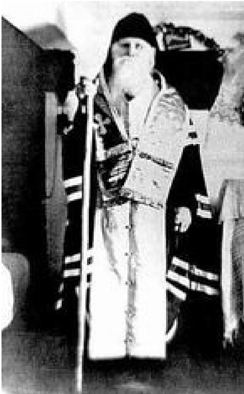
Схииепископ Петр (Ладыгин)

Схииепископ Петр (Ладыгин), один из известнейших в православном мире уроженцев Глазовской земли, вошел в историю как сподвижник Патриарха Тихона. В городе Глазове схииепископ Петр родился, и здесь же завершился его долгий и полный испытаний жизненный путь.